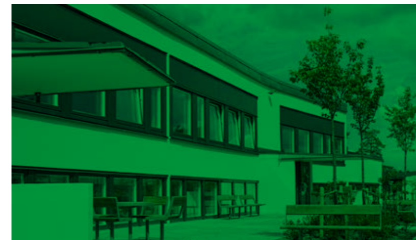
Exteriörbild Engelska skolan