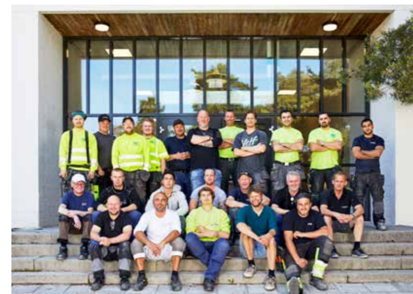
Arbeteam Engelska skolan