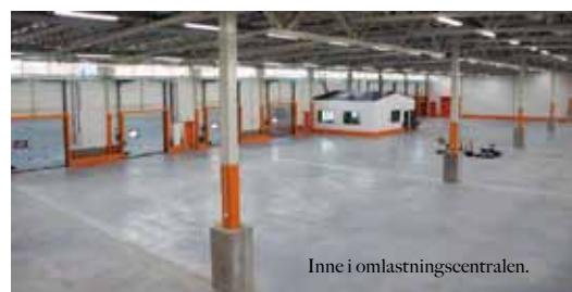
Inne i omlastningscentralen.