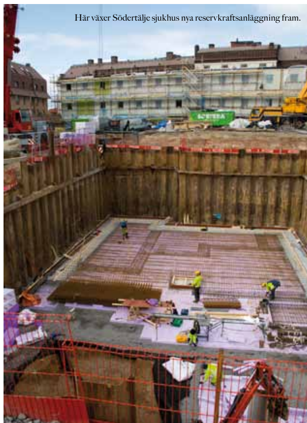
Här växer Södertälje sjukhus nya reservkraftsanläggning fram.

– Vårt samarbete med IN3PRENÖR fungerar alldeles utmärkt och vi har en