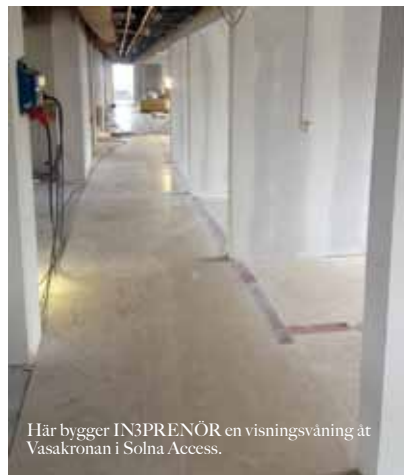
Här bygger IN3PRENÖR en visningsvåning åt Vasakronan i Solna Access.

Arbetet med visningsvåningen ska vara klart i mitten av juni 2014.